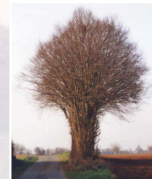
Taille latérale respectueuse et houppier conservé