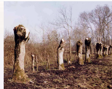
Taille de têtards