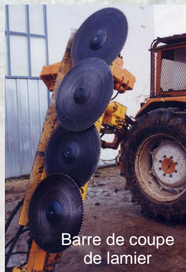
Barre de coupe de lamier