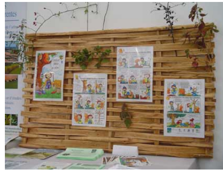
Panneaux : "Comment planter un arbre ?"