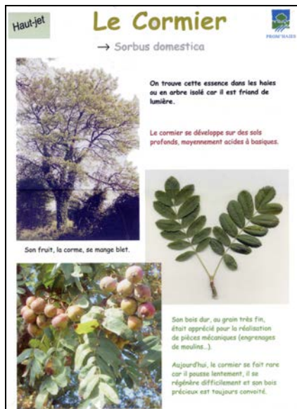
Panneau de l'exposition: 'Quelques arbres, arbustes et buissons de Poitou-Charentes'

Quelques arbres, arbustes et buissons de Poitou-Charentes Châtaignier, chêne, cormier, frêne, merisier, noyer, saules, charme, érable, houx, néflier, noisetier, orme, cornouiller, fusain d'Europe, sureau, troène