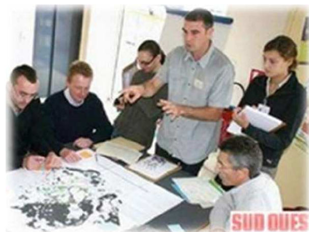
Les couronnais en plein débat