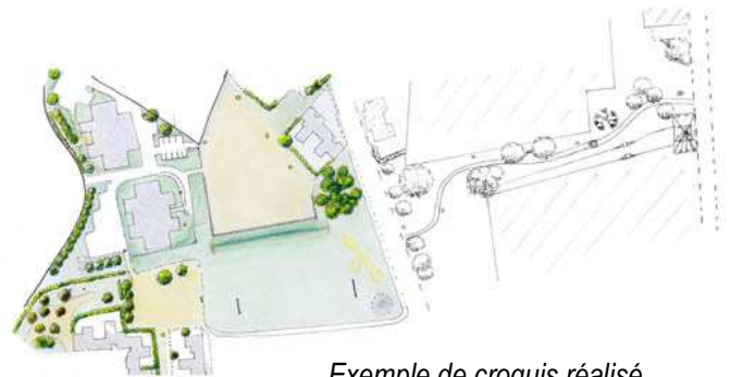
Exemple de croquis réalisé